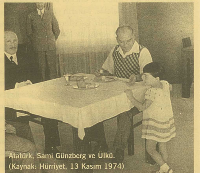
Atatürk, Sami Günzberg ve Ülkü. (Kaynak: Hürriyet, 13 Kasım 1974)

"8 Mayıs 1966 günü Alman Hastanesi'nde hayata veda eden sadece çok yaşlı bir diş hekimi değildi. Hayata veda eden ve Ulus Aşkenaz Mezarlığı'ndaki aile kabristanına defnedilen eski Bahriye Zabit, Osmanlı Devleti'nin çöküşüne, küllerinden yeniden doğan kartal misali Türkiye Cumhuriyeti'nin doğuşuna ve gelişmesine şahit olmuş, demokrasi tecrübesinin 27 Mayıs 1960 ihtilaliyle sonuçlandığını görmüş bir güç simsarı, bir tarihi şahsiyetti. Bizzat tanığı olduğu veya oyuncular arasında yer aldığı onca önemli olaylarla ilgili bildiklerini tarihe mal etmemekte direnen Sami Günzberg sırlarıyla birlikte gömülmeyi tercih etmişti."