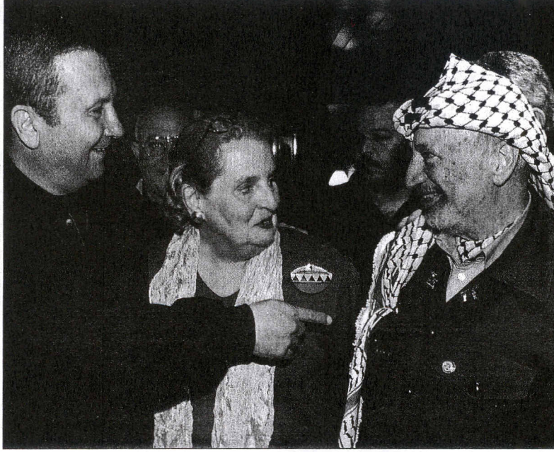
Ortadoğu Barış Süreci yalnız bölge halklarını ilgilendirmiyor, dünyaya yayılmış tüm Yahudiler için de önemli. Düğüm noktası ise Kudüs'ün ne olacağı...

Gayrimüslim yurttaşların yurttaşlıklarına ve Türkiye'ye olan sadakatlerine kuşku ile yaklaşan bir kesimin inkâr edilemez olduğu bir Türkiye'de, yapılması en zor ama bir o kadar en ilginç olan araştırmalardan bir tanesi de diasporada yaşamakta olan azınlıkların anavatanlarına karşı olan tutumları ve kamusal alanda bunu ne şekilde dile getirdikleridir. Bu zorluk nedeniyle bu araştırma alanı tamamiyle bakirdir. Buna rağmen, ihtiyatı elden bırakmaksızın, bazı fikirler ile sürülebilir. Ancak Türkiye Yahudilerinin İsrail'e karşı olan ilgileri ve Barış Süreci karşısında ne hissettiklerini anlamak için her şey-