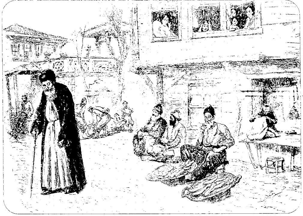
C. Biseo'nun çizgileriyle Hasköy. (Edmondo de Amicis'in Constantinople kitabından)

labilmişlerdi. Sokakta kalan bu kişiler üstlerindeki giysileriyle yakında bulunan Okmeydanı sirtlarına koştular. Ancak yağmur yağmaya başladı, o ana kadar güneyden esen rüzgar kuzeye döndü ve dondurucu bir soğuk başladı. Bu nedenle bu yangınzedeler az veya çok yangından kurtarabildikleriyle kapalı bir yere sığınıp yağmurdan korunmalıydılar. Yanan mahalenin karşısında bulunan Alliance İsrailite okulu bu zavallılara kapılarını açmak için yağmurun yağmasını beklemedi. Okul binası da yangın tehlikesiyle karşılaştığı için tüm öğrenciler evlerine yollanmıştı. Ancak Alliance Okulu semtin tek taş